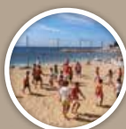
BEACH VOLLEY Beach volley

À PROXIMITÉ IMMÉDIATE DE LA PLAGE Close to the Lamparo beach