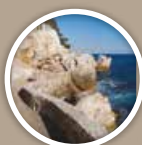
SENTIER LITTORAL DE RANDONNÉE Coastal hiking trail