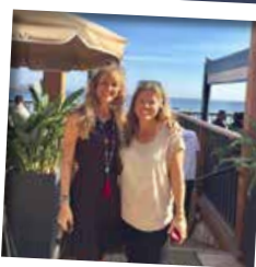
PERNILLA WIBERG Championne olympique, quadruple championne du monde