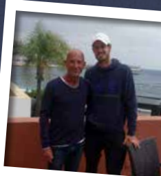
ANDY MURRAY Joueur professionnel de tennis britannique