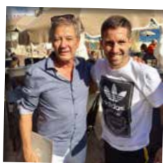
JOÃO MOUTINHO Footballeur international portugais