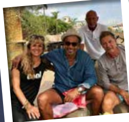
YANNICK NOAH Vainqueur de Roland Garros, entraîneur de Coupe Davis et chanteur