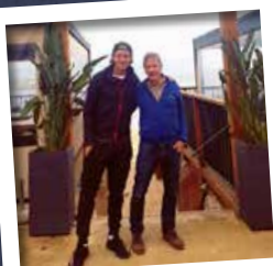
LUCAS PUILLE Joueur professionnel de tennis français