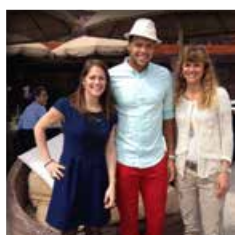
JO-WILFRIED TSONGA Joueur professionnel de tennis français