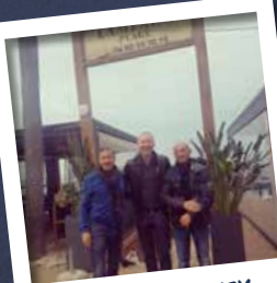
VADIM VASILYEV Vice-président de l'AS Monaco depuis août 2013