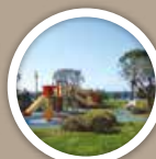
JEUX D'ENFANTS Kids playground