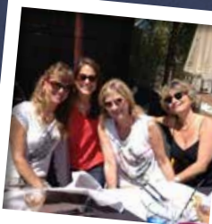
MICHÈLE LAROQUE Actrice, réalisatrice, productrice, humoriste, comédienne française