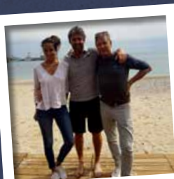
SAPHIA AZZEDINE Romancière franco-marocaine, également actrice, scénariste et réalisatrice