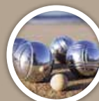
PÉTANQUE Petanque strip