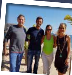
PIERRE FROLA Quadruple recordman du monde d'apnée