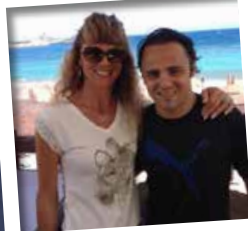
FELIPE MASSA Le Brésilien Felipe Massa, champion de Formule 1