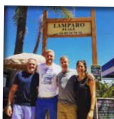
KAMIL GLIK Footballeur international, champion de France avec l'AS Monaco