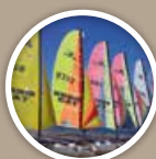
BASE NAUTIQUE Water sports centre